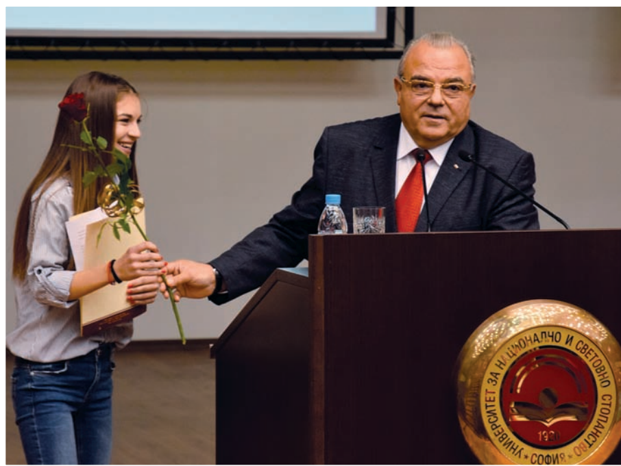
Ректорът на УНСС награждава първокурсничката с най-голям бал